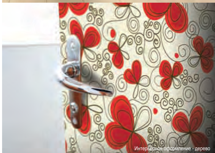
Интерьерное оформление - дерево