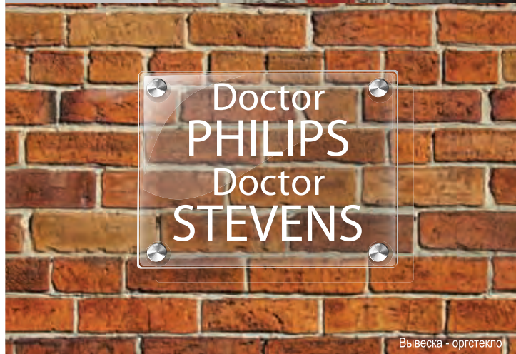
Вывеска - оргстекло